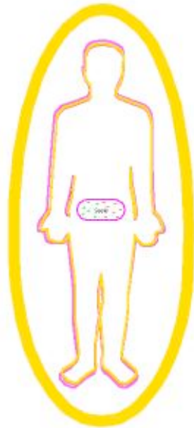
Astralleib + Aura + Seele

Nach unserem Tod besitzen wir nur noch einen feinstofflichen Körper. Dieser ist ein feinstoffliches Abbild unseres physischen Körpers.