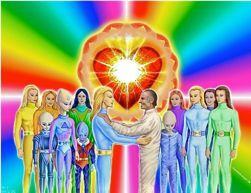
Unsere kosmische Familie

Hunderttausende intelligente und friedliebende Zivilisationen die uns Millionen von Jahren in der Entwicklung voraus sind, haben sich in der „Föderation des Lichtes“ - die auch „Göttliche-Allianz“, „Konzil der Wächter“ oder „Interdimensionale Föderation Freier Welten“ genannt wird - zusammengeschlossen. Sie umfasst 33 Weltraumsektoren aus unserem heimischen Universum mit über 5.000 Welten-Center-Planeten in verschiedenen Galaxien. Doch einige wenige, weniger friedliebende, hochentwickelte Zivilisationen haben ein anderes weniger selbstloses Wertesystem und sich in der „Allianz von Anchara“ zusammengeschlossen, die einen destruktiven Gegenpool zur Föderation bilden.