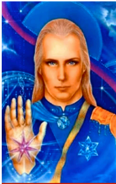
Ashtarsheran Kommandant der Galaktischen Föderation

Verbündete der Anchara-Allianz - destruktive „Graue“ aus dem Betelgeuze System - sind seit 1931 hier auf der Erde und haben sich mit den Amerikanern zusammengeschlossen. Gegen Austausch von Technologie durften sie Menschen entführen und Experimente an ihnen vornehmen. Die Amerikaner waren bei diesem Deal nie darauf aus, die Probleme auf der Erde zu lösen, sie waren von Anfang an nur an Techniken zur Unterdrückung und ihrer Machterhaltung interessiert.